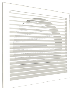
CM, CMP mřížka s pevnou žaluzií