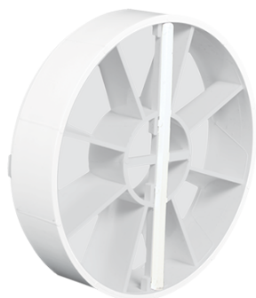
BDS zpětná klapka