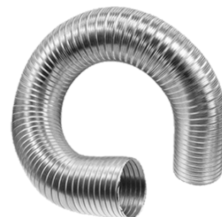
KLIMAFLEX ohebné hliníkové potrubí