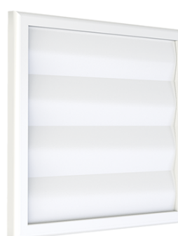
CM Z, CMP Z mřížka se samotížnou žaluzií